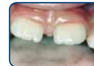
Tanden van het blijvend gebit hebben een kartelrand