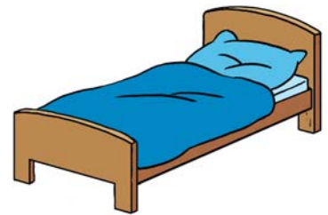
Voor het slapen