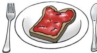
Na het ontbijt