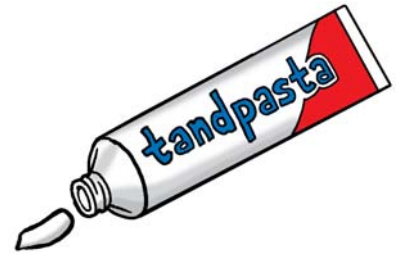
Een klein beetje tandpasta